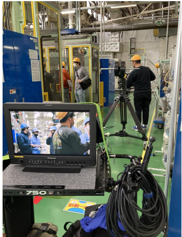
防振ゴムの生産ラインでの撮影の様子

制作にあたっては、研究開発および生産のマザー拠点である小牧本社・製作所（愛知県小牧市）において、技術研究所「テクノピア」、開発を担う「テクニカルセンター」、世界トップシェアを誇る自動車用防振ゴムの製造工場を中心に撮影を行いました。高い精度や品質が求められる、緊張感漂う各現場の様子や、課題や困難に果敢に挑戦する従業員の真剣な眼差しなどをご覧いただければと思います。