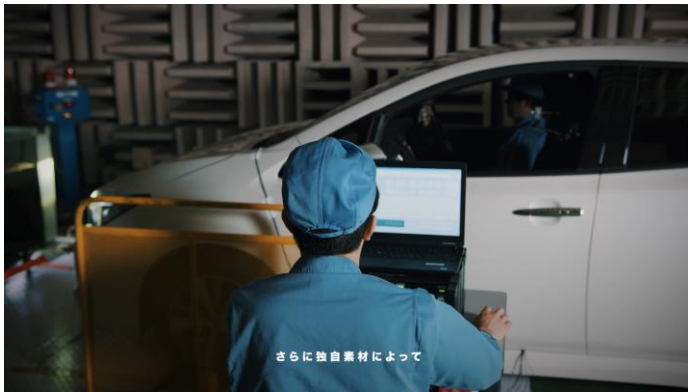
さらに独自素材によって 無響室で実車評価を行うシーン