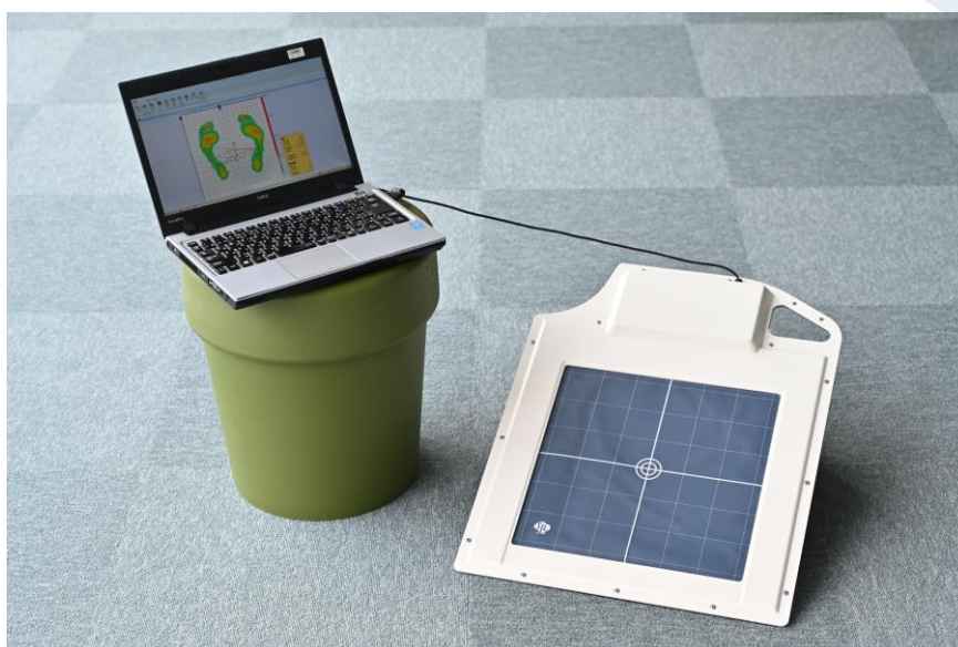
SR ソフトビジョン（足圧版） （※パソコンは製品に含まれません）