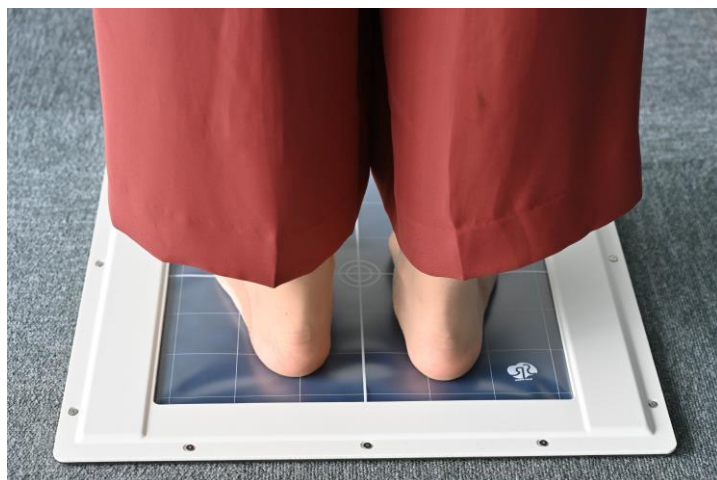
立位での足圧計測イメージ

SRソフトビジョン（足圧版）の表示画面イメージ。上がつま先側、下がかかと側で、数値と色で圧力分布がわかる。中心部の赤い線は面圧中心の移動軌跡を描いたもの