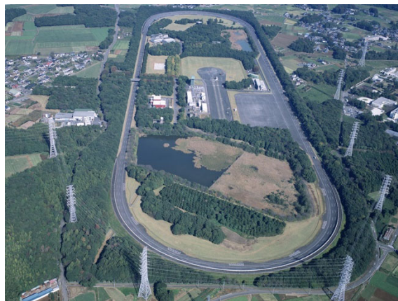
図1 産総研テストコース全景(1981年11月完成)

テストコース(図1)の東西全3車線を改修し、それぞれ最外周の第3車線には合計6つの特殊路(車両評価のための特殊な路面)を設置した(図2)。これにより、直線部の走行がよりスムーズになるとともに、実際の路面を模擬した特殊路を活用して、乗り心地などに関して実際の走行状況に即した車両評価が行えるようになった。