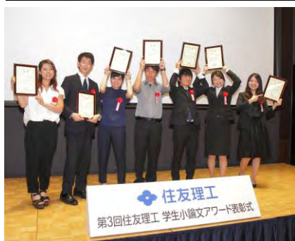
昨年度（第3回）受賞式の様子