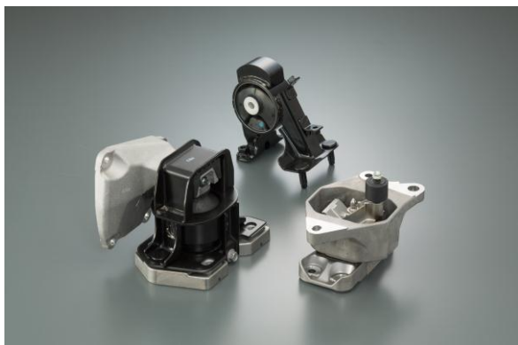
トヨタ自動車「MIRAI」に搭載されているモーターマウント

当社グループはこれまでに、モーターを使用するハイブリッド自動車（HV）、プラグインハイブリッド自動車（PHV・PHEV）、電気自動車（EV）などさまざまな次世代車向けに、モーターマウントを供給してきました。モーターを支持し、モーター振動の低減と走行時の乗り心地の向上を果たす本製品は、日本をはじめ、欧州でも採用実績があり、大衆車から高級車まで幅広く使用されています。