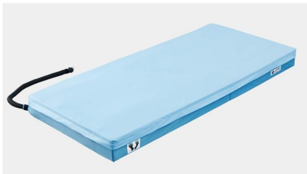
アクティブマットレス本体