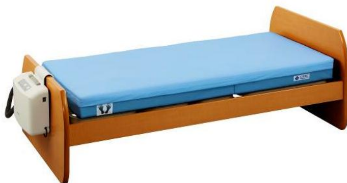
SR アクティブマットレス 体圧ブンさん （※ベッドフレームはシステムに含まれません）