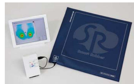
SR ソフトビジョン【無線版】 (タブレット端末は含みません)