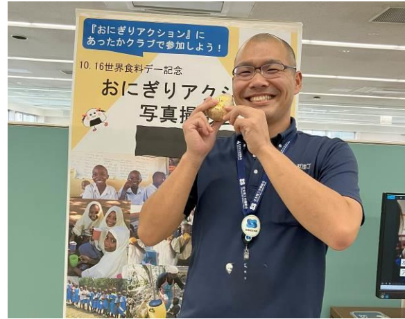
おにぎりアクション 2024 社内イベントの様子

当社グループは、創立 100 周年を迎える 2029 年に向け、3 つの方向性「未来を開拓する人・仲間づくり」「柔軟かつ強固な組織づくり」「持続可能な社会に向けた価値づくり」を定めています。新たな社会的価値の創造を実現する企業グループへ飛躍するために、今後も CSR 活動や SDGs の開発目標に資する社会課題解決への積極的な取り組みを通じて、サステナブルな社会づくりに貢献してまいります。