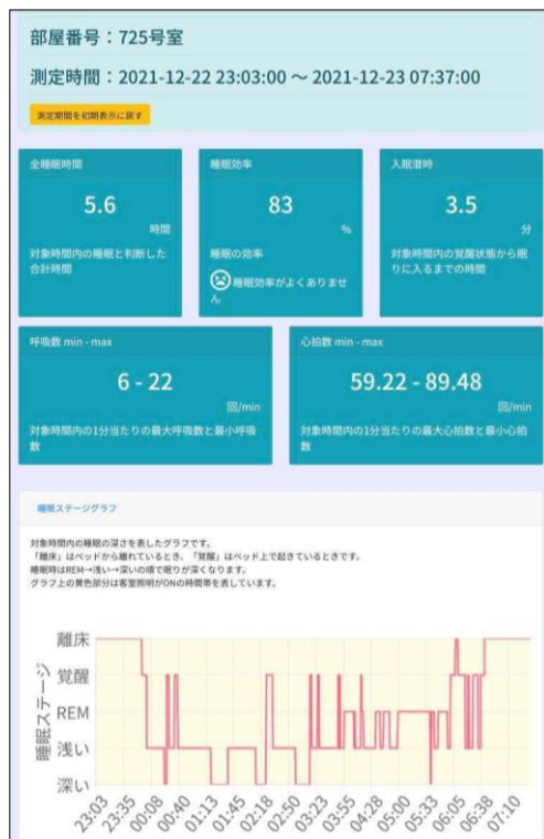
<レポートイメージ>