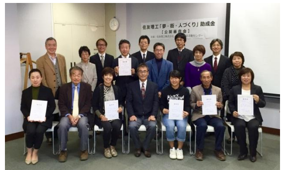
2015年度助成金交付団体の皆様

このプログラムは、松阪市民活動センターと協働で2014年にスタート、今回で3回目を迎えます。当社と松阪市民活動センターが、「ダイバーシティ」「青少年の育成」「まちづくり」「市民活動」「自然環境との共生」の5分野において、特に社会へ貢献していると審査した活動へ助成金を支給するものです。