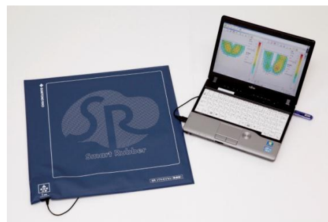
SR ソフトビジョン(数値版)