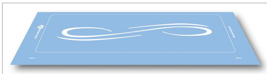
新発売した SR ソフトビジョン（全身版）