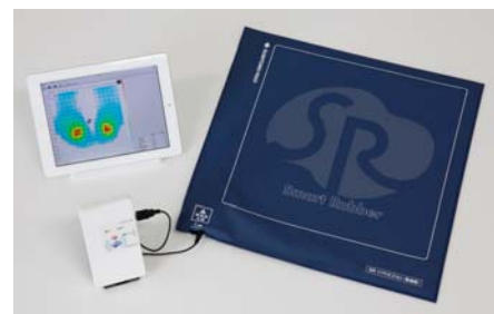
SR ソフトビジョン【無線版】 (タブレット端末は含みません)

※SR Soft Vision およびスマートラバーは、住友理工の登録商標です。