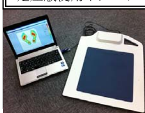
足圧版使用イメージ