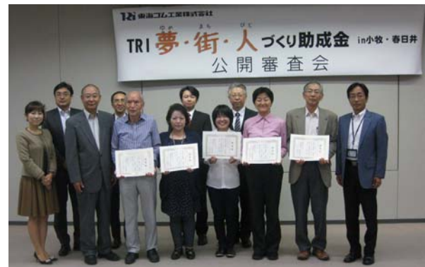
2013年度の助成金交付団体の皆様

このプログラムは、特定非営利活動法人こまき市民活動ネットワークと協働で、2010年度にスタートし、今回で5回目になります。当社とこまき市民活動ネットワークが、「障がい者福祉」「文化芸術振興」「青少年健全育成」「安心・安全な社会づくり」「環境との共生」の5分野について、特に貢献していると審査した活動について、助成金を支給するものです。